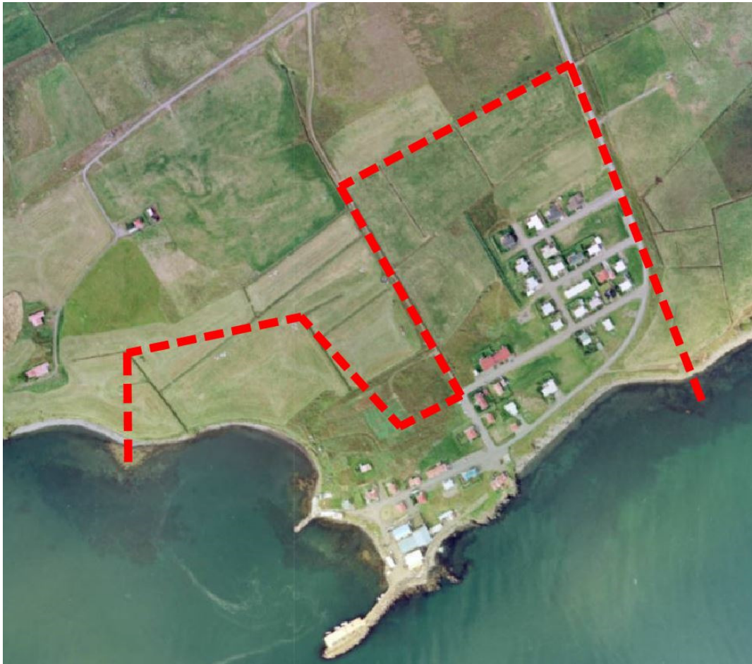
Yfirlitsmynd af skipulagssvæðinu