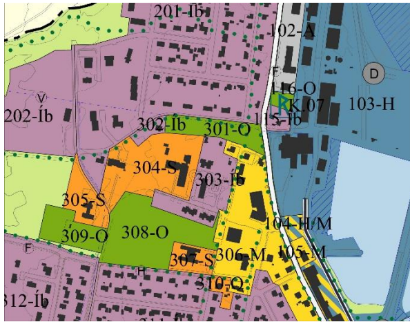
Mynd 3: Gildandi aðalskipulag.

Fyrir liggja frumdrög að breytingu á aðalskipulagi svæðisins. Við gerð skipulagstillögunnar verður gerð tillaga um endurskoðuð skipulagsákvæði landnotkunarreitanna. Meginatriði áformaðrar aðalskipulagsbreytingar er stækkun íbúðarsvæðis 302-Íb á kostnað stofnanasvæðis 304-S og opins svæðis 301-O.