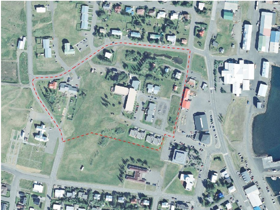
Mynd 2: Skipulagssvæðið

Skipulagssvæði er 5 ha að stærð og afmarkast af Böggvisbraut í vestri, Karlsrauðatorgi í norðri og austri og af opnu útivistarsvæði í suðri. Innan skipulagssvæðisins eru í dag fjórtán íbúðir í einbýlis-, rað- og parhúsum, Dalbær heimili fyrir aldraða og leikskóli. Láginn, útivistarperla Dalvíkur, er einnig innan skipulagssvæðisins.