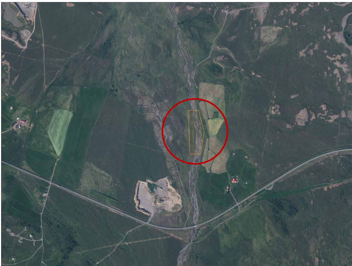
3. mynd. Fyrirhuguð efnisnáma afmörkuð gróflega á loftmynd frá 2019.

Svæðið sem um ræðir teygir sig niður með bökkum Hálsár. Í heildina er það um 24.000 m 2 og gerir framkvæmdaraðili ráð fyrir um 49.000 m 3 malartekju þar næstu 4-5 árin. Þarna verður farið á allt að 3 m dýpi í tekju en þó einungis miðað við 0.5 m dýpt undir vatni. Einhver fiskgengd er í Hálsá en hún hefur ekki verið nýtt til veiðihlunninda. Eins og áður hefur komið fram er meginmarkmið framkvæmda að verja umliggjandi ræktað land og lyngmóa. Einnig er hún hugsuð sem tilraunaverkefni, þannig að farvegur árinna verður breikkaður og myndaðar tjarnir með það að markmiði að koma á búsvæði fyrir sjóbleikju.