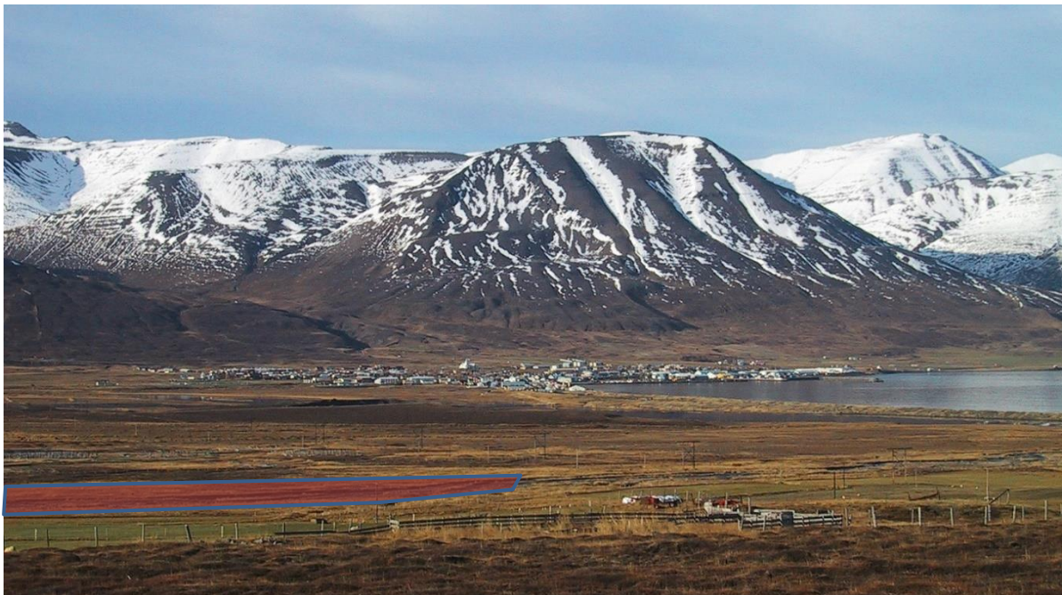
1. mynd. Norðurhluti fyrirhugaðrar efnistöku merktur í grófum dráttum með rauðum fleti. Séð frá Þjóðveginum við minnismerki um séra Friðrik Friðriksson.

Fyrirhuguð breyting á aðalskipulagi felst í því að skilgreina heimild fyrir efnistöku við Hálsá, sem er forsenda framkvæmdaleyfis. Fyrirhuguð efnistaka er um 49.000 m 3 á um 2,4 ha lands á vesturbakka árinna. Efnistökusvæði 2,5 ha eða stærri og/eða 50.000 m 2 eða stærri eru tilkynningarskyld til Skipulagsstofnunar sem úrskurðar um það hvort meta þurfi umhverfisáhrif þeirra. Fyrirhuguð náma er því ekki tilkynningarskyld til Skipulagsstofnunar.